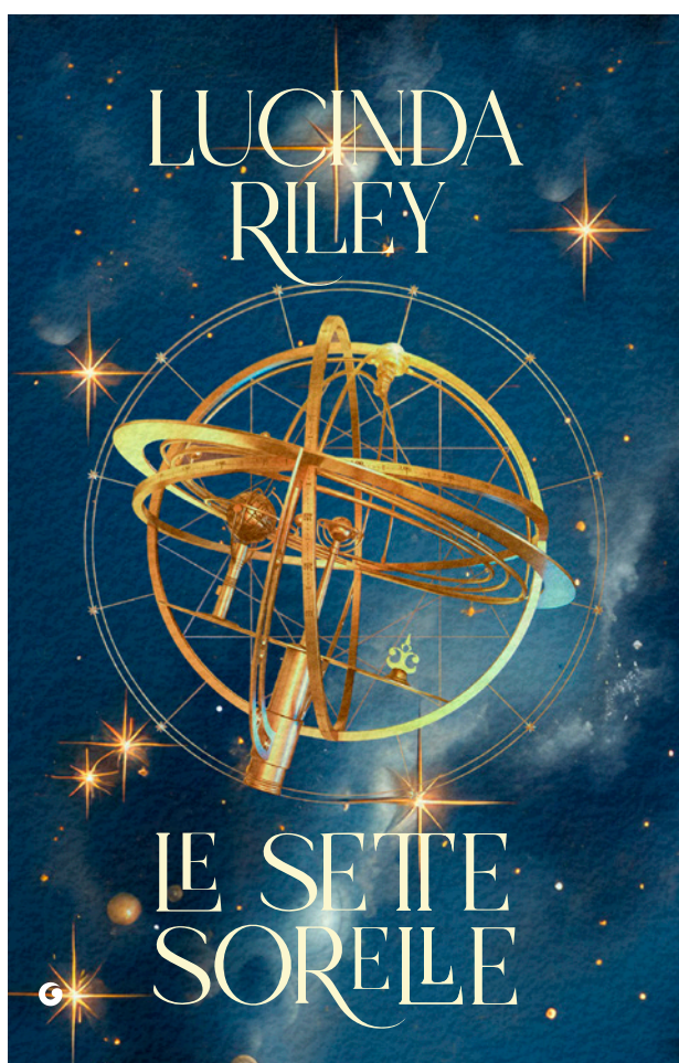
Le Sette Sorelle cm 57010A / 9788809923881